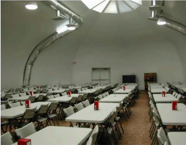
Comedores y Recintos Deportivos