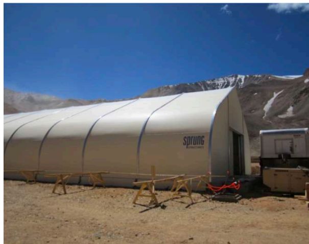
Pascua Lama, Argentina.