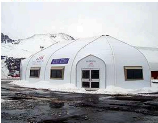
Valle Nevado, Chile.